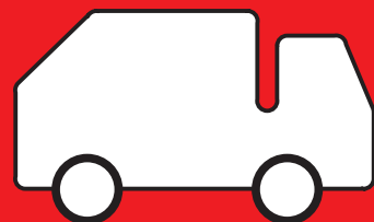
TRI ET TRANSFERT