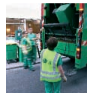
figure au premier rang de nos priorités. Respect des collaborateurs, attachement au dialogue, politique d'hygiène, santé et sécurité, formation professionnelle, motivation des équipes : nous avons réuni

Nos collaborateurs sont notre première force. Ils exercent des métiers difficiles et font preuve d'une grande implication. En retour, la responsabilité sociale