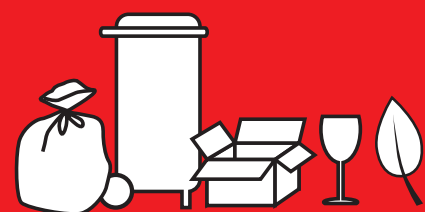
COLLECTE DES DECHETS

Opérateur global en matière de gestion des déchets et de nettoyage urbain, Derichebourg se positionne comme un apporteur de solutions sur mesure, adaptées aux besoins et enjeux spécifiques de chaque collectivité et de chaque site. Notre offre de prestations, très diversifiée, évolue constamment, à l'écoute des nouvelles attentes et des obligations réglementaires.